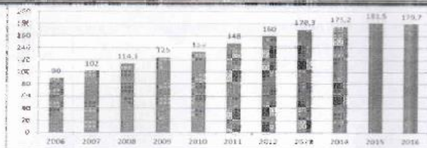
Рис. 2. Площадь сельскохозяйственных угодий под генетически-модифицированными культурами (млн. гектаров)

Источники: Сформировано автором на основе данных источника [1]